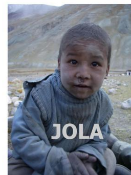
Tvorba a prezentace autorského inscenačního projektu Tanečního studia Light v roce 2014

• Týden prevence s filmy Heleny Třeštíkové v pražském kině Světozor - projekce časověných dokumentárních filmů Mallory a Katka s následnými debatami se zajímavými hosty (neziskové organizace, preventisté, zástupci ministerstev). Hlavním hostem všech projekcí byla Mallory osobně. Oba dva filmy poutavým způsobem vypráví životní příběhy dvou žen, které bojují s drogami a životem na ulici. Mallory svůj boj vyhrála, a proto nabízí zajímavé srovnání s osudem Katky. Pro 1., 2. a 3. ročník (10. a 11. 12. 2015)