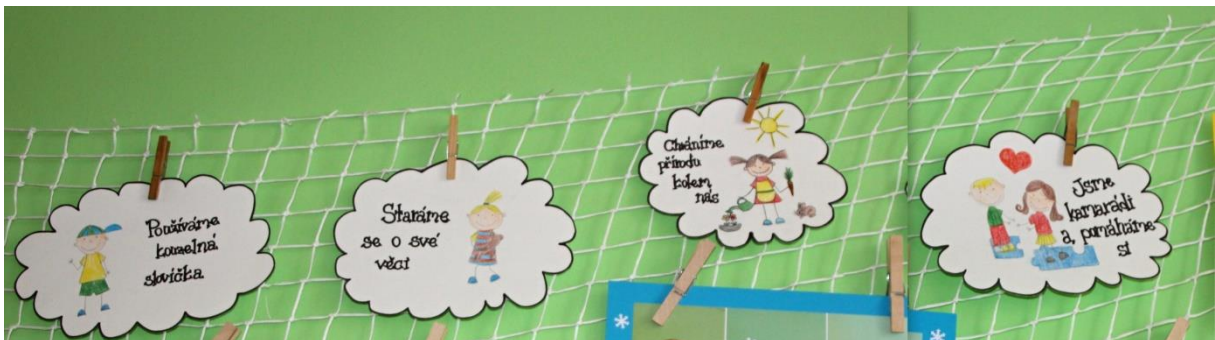
Obrázek č. 5: Inspirativní ukázky formulovaných pravidel dětí v mateřské škole jako osvědčená prevence rizikového chování dětí