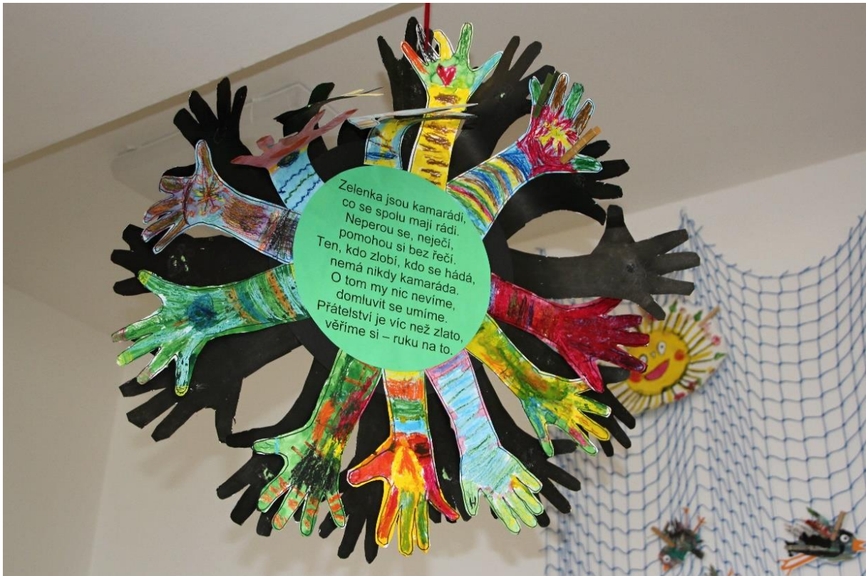
Obrázek č. 4: Úmluva v zelené třídě