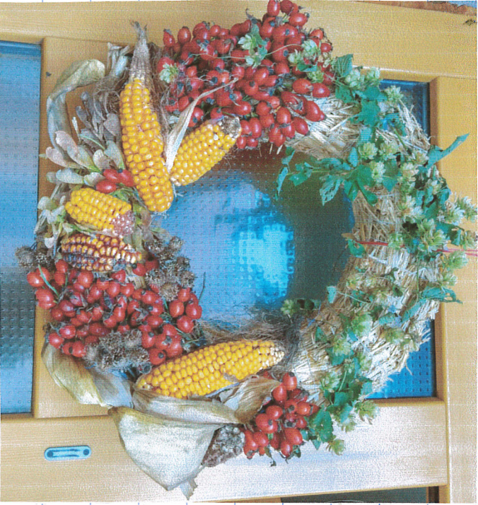
↙ Mluví Barča

1. 10. 2006 Neděle byl jsem s mamkou a Továrníkem (bratry) v lese na procházce. Kastříha li jsme si šípky, bodláky, chmel a kukuřici a pomáhal jsem mamce udělat podzimní věneček na dveře.