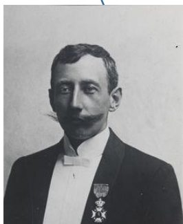
Norský polárník Roald Amundsen (1899)