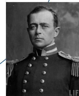
Robert Falcon Scott v uniformě britského námořnictva (1910)