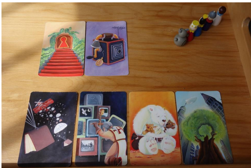
Obrázek 1 Reflexe s využitím karet Dixit