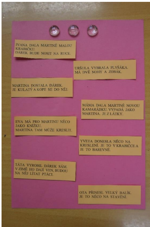
Obrázek 3: Úroveň čtení 3 v 1. ročníku