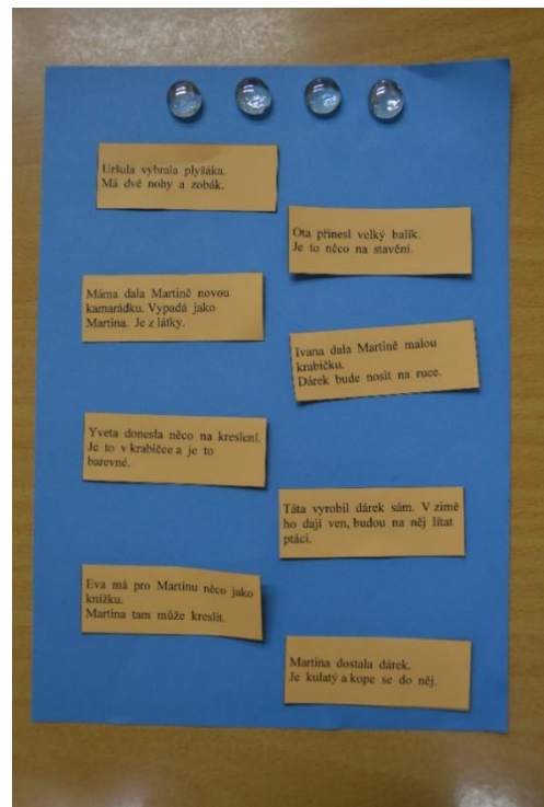
Obrázek 4: Úroveň čtení 4 v 1. ročníku