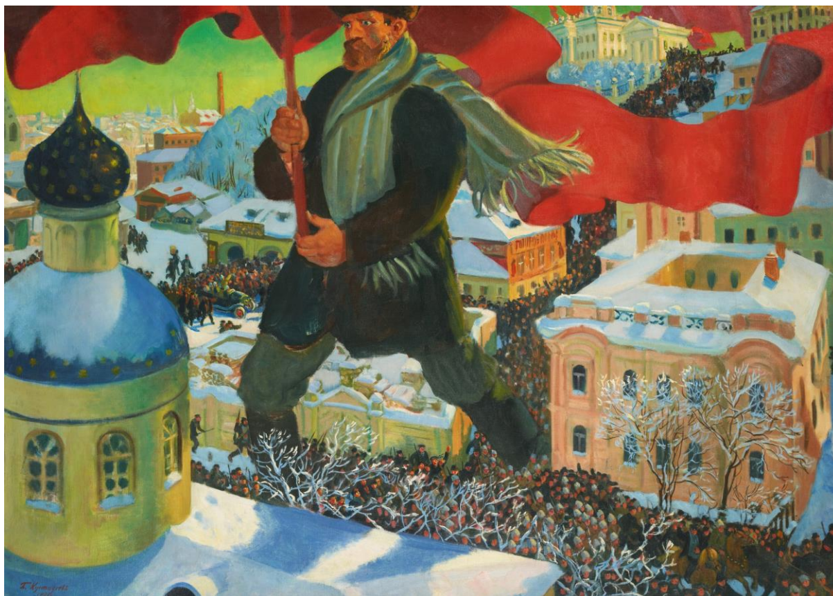
Obrázek 5: Boris Kustodiev: Bolševik, 1920. Obraz se stal uměleckým vyjádřením Velké říjnové socialistické revoluce

Prohlédni si umělecké dílo a odpověz na otázku.