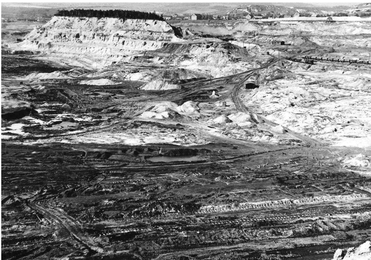
Obrázek 4: Povrchový uhelný důl nedaleko Světce u Bíliny, Mostecká pánev, 50. léta 20. století. První důlní šachty byly v okolí vybudovány po roce 1760. Nedaleký povrchový lom Bílina má být podle současných těžebních limitů v provozu do roku 2030

Co vypovídá o industrializaci a jak s ní souvisí: