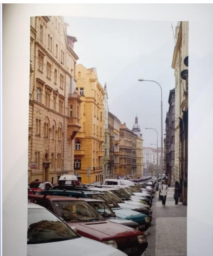
Trojanova ulice, 2007