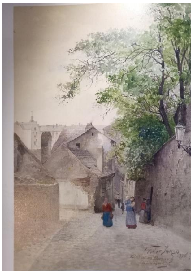
„Kočí ulice Na Slovanech (u studánky)“, 1896

Část 1 – Prohlédněte si obrázky jedné ulice a v tabulce pod nimi charakterizujte rozdíly mezi nimi.