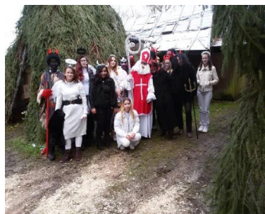
Mikulášská jízda na Hřebenech