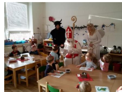
Nadílka pro děti z MŠ