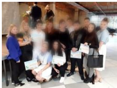
Děčínská vlna 2020 – soutěžní tým oboru Kadeřník