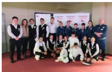
Tým pro zajištění cateringu akce IX. hry olympiády dětí a mládeže ČR 2020