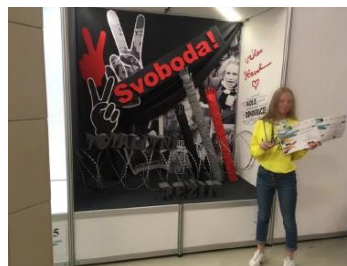
Vítězná výkladní skříň na téma 30 let od sametové revoluce