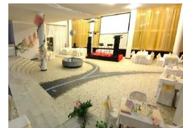
Výzdoba prostor pro reprezentační ples města Sokolova na téma „Královský bál“