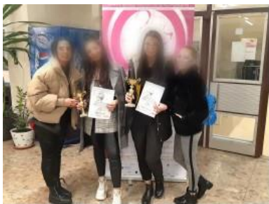
European Open International Championship 2020 – tým žákyně oboru Kosmetické služby, které obsadily 2. a 3. místo