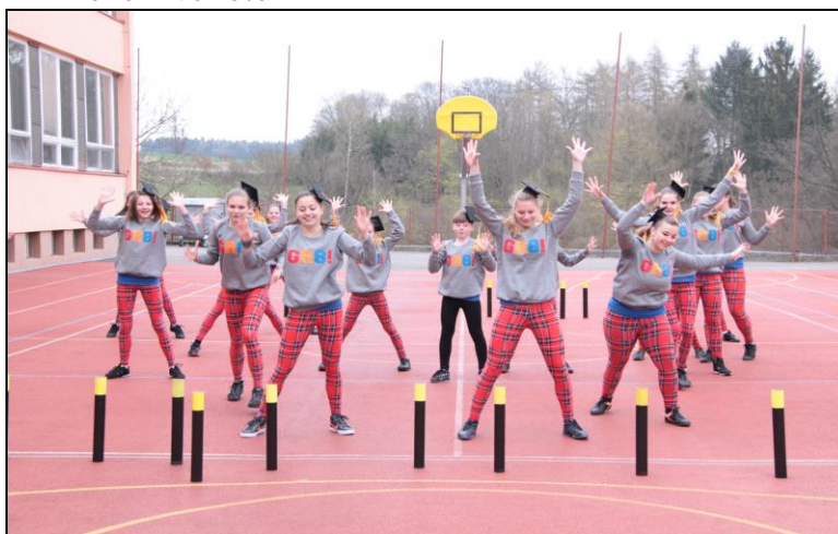
Obrázek: MODERNÍ TANCE