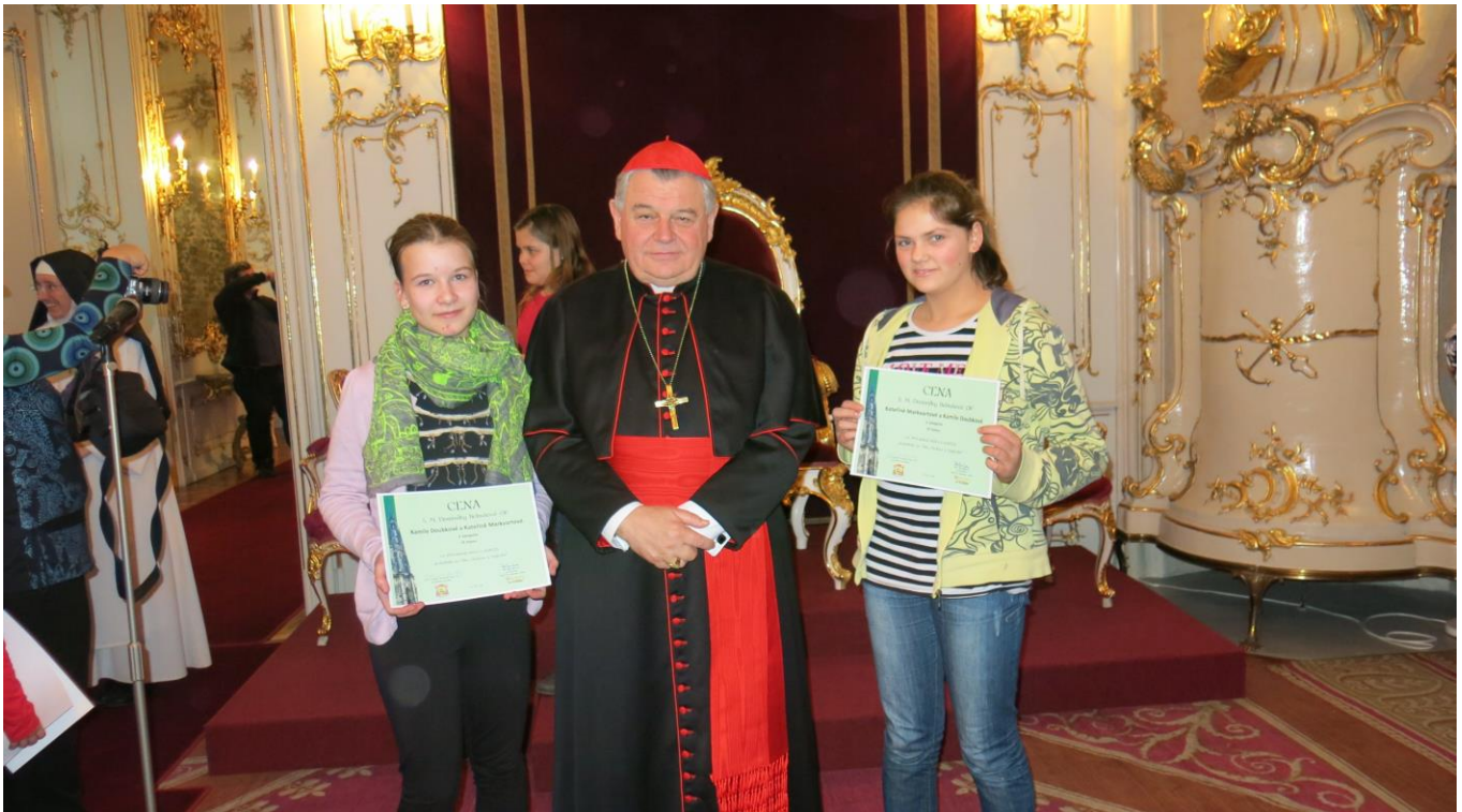
V Arcibiskupském paláci převzala děvčata z rukou Dominika kardinála Duky cenu za výtvarnou soutěž