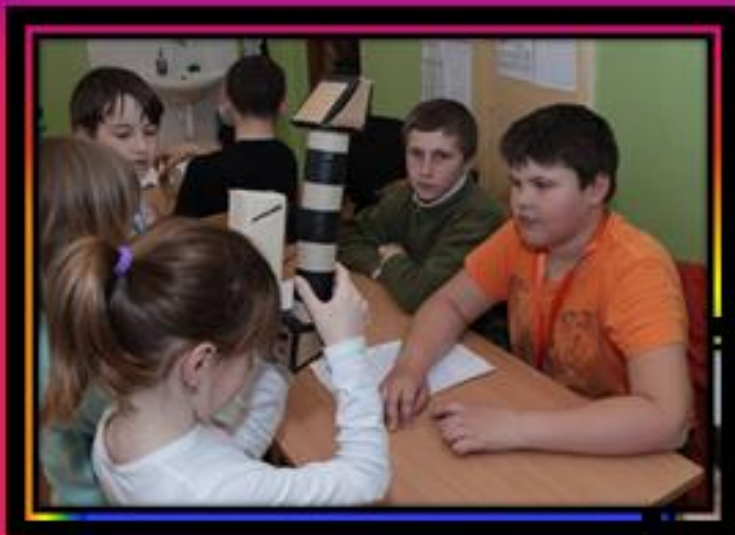
Periskop a mikroskop